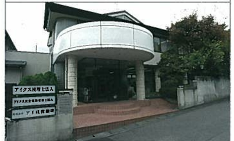
アイクス税理士法人様の本社社屋（静岡市駿河区）。

本社所在地 静岡県静岡市駿河区池田3875-92 設立 2004年 社員数 50名 年商 4億円 事業内容 税理士事務所として、税務・決算・申告書作成、経営計画、資金計画、財務代理業務から開業支援、相続税申告業務などのサービスを展開。激変する環境下で正確な経営情報をいち早く提供することで、経営者の意思決定を支援している。