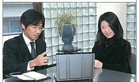
機密データを保管していないモバイルノート型端末から、本社内に設置した仮想PCサーバへアクセスし、顧問先オフィスでプレゼンテーションを行っている。