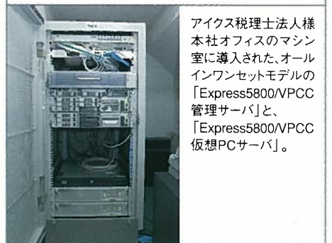
アイクス税理士法人様本社オフィスのマシン室に導入された、オールインワンセットモデルの「Express5800/VPCC管理サーバ」と、「Express5800/VPCC仮想PCサーバ」。