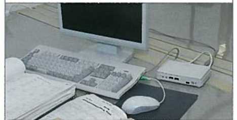
本社オフィスに導入されている手のひらサイズのシンククライアント端末「US100」。端末本体にはハードディスクやファンを持たず、省スペースと低消費電力、静音性の向上を図ったモデルである。通常のPCと同等の、スムーズな業務処理環境を実現している。